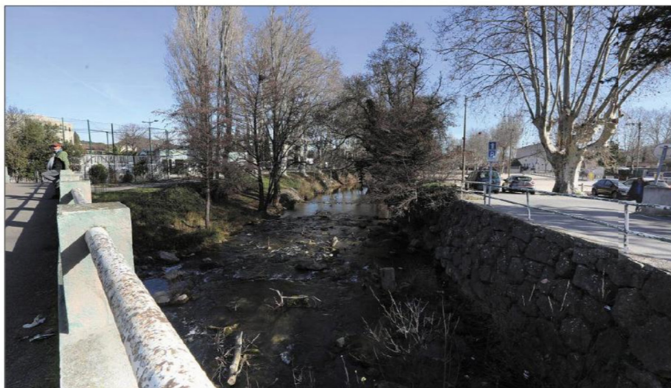
Au niveau de la passerelle Sadi-Carnot, les travaux concernent, outre les berges, le remplacement et l'agrandissement de ce pont. Le city-stade, lui, sera déconstruit.