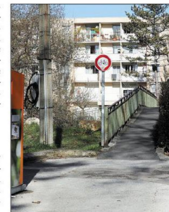
La passerelle située au bout de l'avenue de La Burlière, vers les HLM de la cité Carami, va être déplacée.

D'autres voix se sont fait entendre pour évoquer les solutions alternatives qui auraient pu être envisagées. Trop cher ou pas assez efficaces, c'est avec le souci du détail que les différents intervenants ont répondu aux questions. Au final, malgré des inquiétudes toujours manifestes pour certains, c'est dans une relative sérénité que s'est close la discussion. En attendant la prochaine.