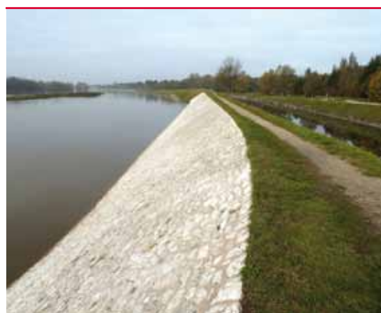
Digue sur la Loire en crue

tique toute augmentation du niveau de protection d'un système d'endiguement devra s'inscrire, pour être éligible à l'aide de l'État, dans le cadre d'un projet global de prévention des inondations labellisé PAPI.