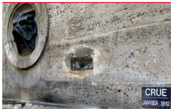
Repère de crue

Les informations peuvent être recueillies à partir de données existantes : événements historiques, atlas des zones inondables, plans de prévention des risques naturels d'inondation, plans communaux de sauvegarde, études et modélisations hydrauliques réalisées par les services de l'État et/ou les collectivités locales, repères de crues et laisses de mer, etc. Les caractéristiques des inondations, en l'absence d'ouvrages de protection ou en cas de dépassement de leur niveau de protection, ne seront pas occultées.