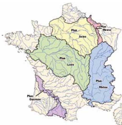
Les plans grands fleuves

pouvant faciliter la réalisation de projets de PAPI. On veillera donc à ce que l'organisation de la gouvernance des projets de PAPI émergents sur le territoire couvert par un plan grand fleuve soit cohérente, voire intégrée, avec celui-ci. Tout nouveau projet de prévention des inondations reste cependant soumis au processus de labellisation PAPI, sauf s'il a déjà fait l'objet d'une contractualisation.