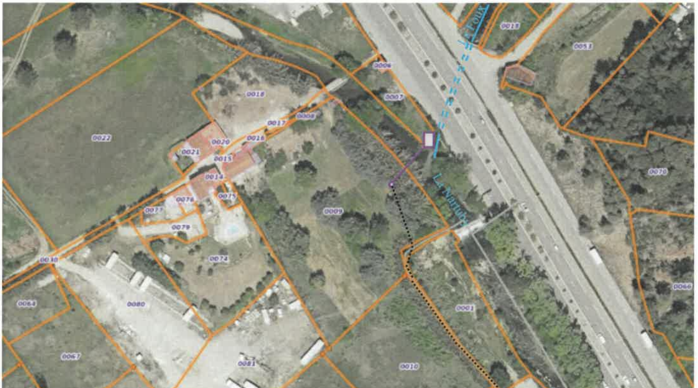
Extrait cadastral

L'A.S.F. des canaux du Plan et du Vignaret est propriétaire du canal du Plan (tiretés noirs sur le plan ci-dessous) et sera propriétaire d'une chambre de prise d'eau en bordure de RD1555 (rectangle gris et violet) et d'un siphon sous la Nartuby (tracé violet), au droit de la rencontre de la Nartuby et de son affluent La Foux, au droit des parcelles AN 07 et 09 sises sur la commune de Trans-en-Provence (Var) ( en tiretés noirs sur le plan ci-dessous ).